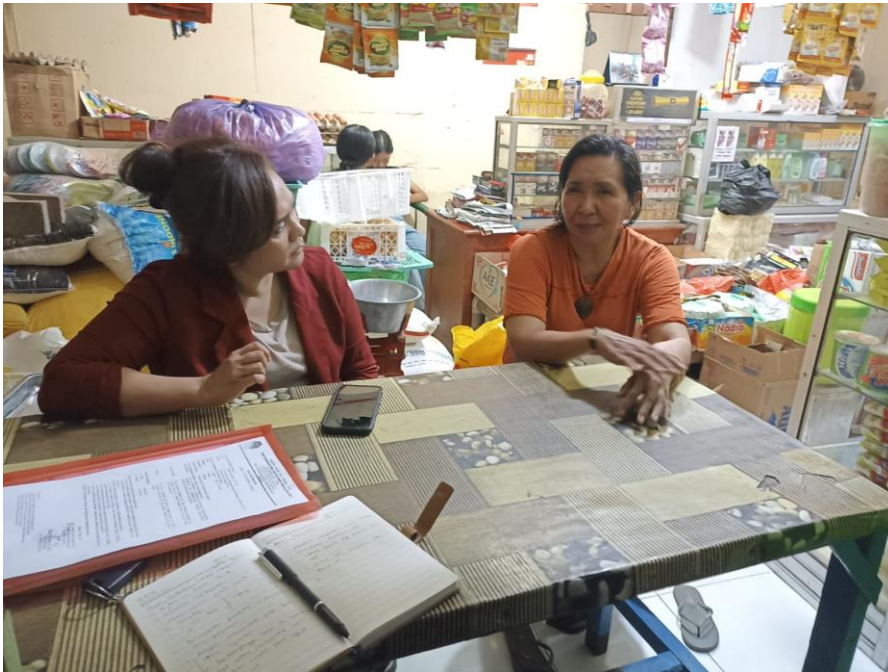
Gambar 3. Wawancara yang dilakukan dengan Ketua Asosiasi Pengrajin Tenun Ikat Alor