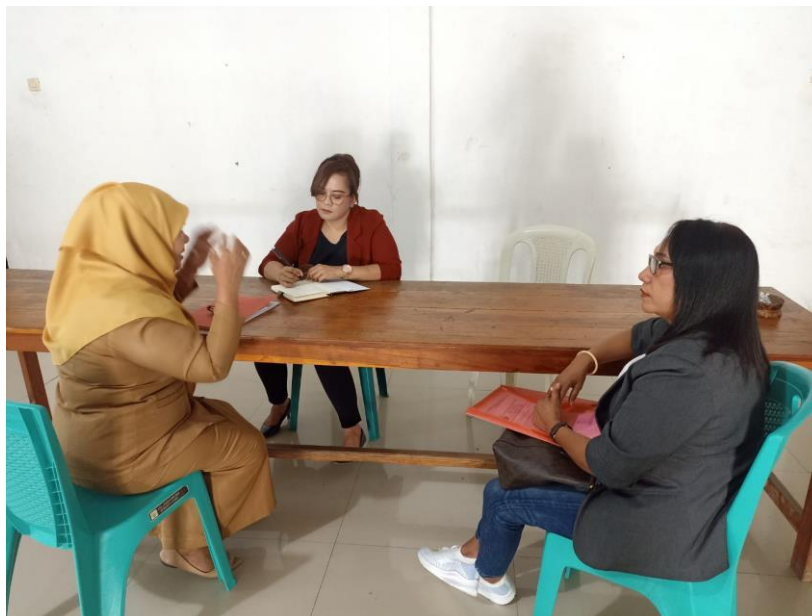
Gambar 2. Wawancara yang dilakukan dengan Dinas Perindustrian dan Perdagangan Kabupaten Alor terkait dengan Asosiasi Pengrajin Tenun Ikat Alor (APTIA), Asosiasi Pengrajin Tenun Songket Alor (APTSA)