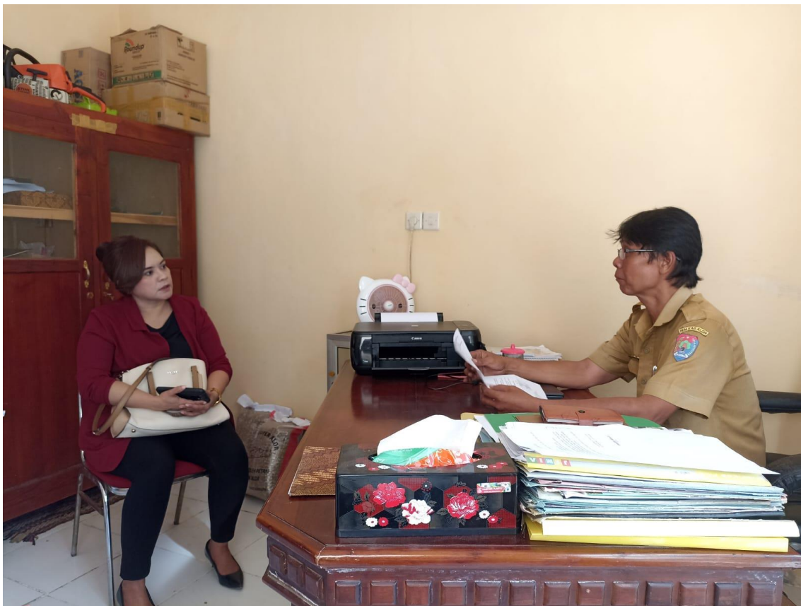
Gambar 1. Wawancara yang dilakukan dengan Dinas Pertanian Kabupaten Alor terkait dengan Asosiasi Petani Vanili Kabupaten Alor