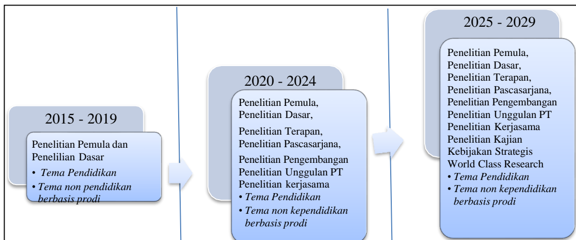
Gambar 4.1. Diagram roadmap penelitian dan PKM berdasarkan kategori penelitian.

Berdasarkan jenis penelitian, maka arah penelitian di FH Undana sebagai berikut :